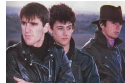
Duncan Dhu La Orquesta Mondragón