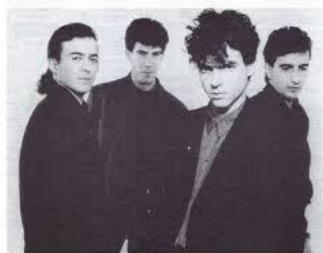
Tam Tam Go (Badajoz)