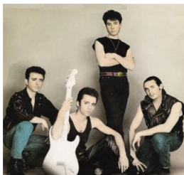
La Guardia (Granada)