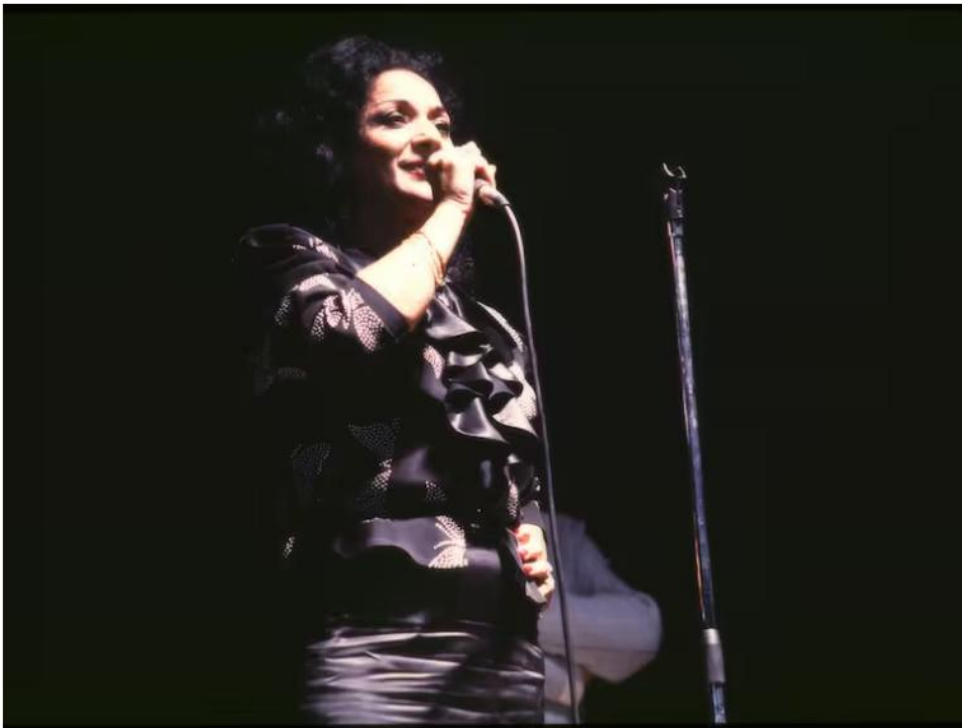
Lola Flores, durante un concierto en 1982

Celebramos el centenario de una de las cantantes más populares de las últimas décadas en la música y la cultura españolas