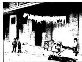
La vivienda y el "utilitario". Aquí se sitúan problemas de aprendizaje. Después es secretario pone el satirista.

Me dijo: "No, no hay plaza". Y cuando todos las manifestaciones iniciales de la madre de que había plaza, se me dijo, "no, no hay plaza".