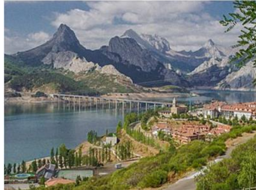
Viejo Riaño y nuevo Riaño

Alrededor de 500 pueblos fantasma yacen bajo las aguas de embalses y pantanos en España. Muchos de ellos fueron literalmente engullidos al construir -o derrumbarse- alguna de estas obras faraónicas levantadas, en su mayoría, durante el Franquismo , período en el que se construyeron alrededor de 515 pantanos . El país pasó de 4.000 millones de metros cúbicos de agua a más de 36.600 millones. Otros por la erosión natural o el aumento del cauce del río más cercano. Algunos ya no aparecen en los mapas, es imposible borrarlos de la memoria y de la vista, gracias a los homenajes que les rinden sus antiguos habitantes, o a las sequías, que se encargan de devolverlos a su lugar original y mostrar lo poco o mucho que queda de ellos. https://www.65ymas.com/ocio/viajes/10-pueblos-de-espana-sumergidos-bajo-el-agua_3296_102.html