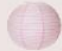
lámpara de papel