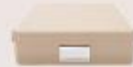
caja de cartón