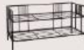
zapatero de hierro