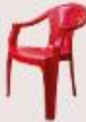
silla de plástico