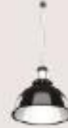
lámpara de metal