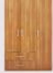
armario de madera