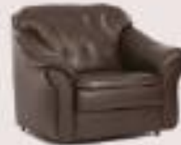
sillón de piel