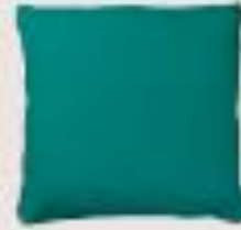
cojín de tela