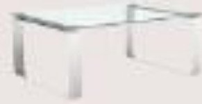
mesa de cristal