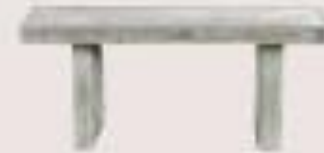
mesa de piedra