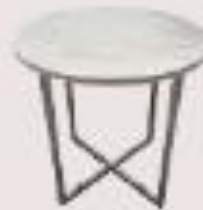
mesa de mármol