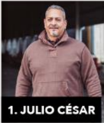
1. JULIO CÉSAR