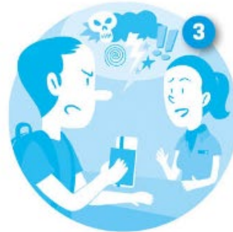
hacer una reclamación