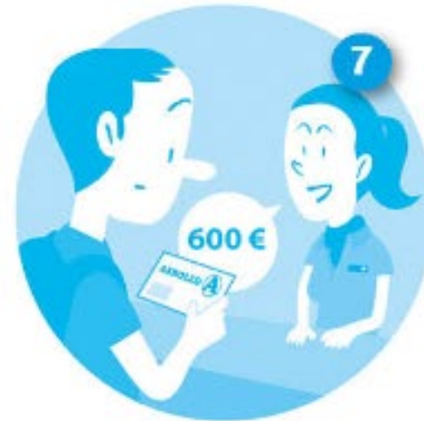
recibir una indemnización