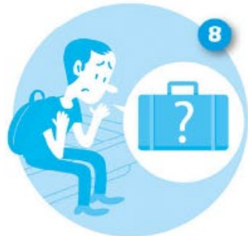
perder el equipaje