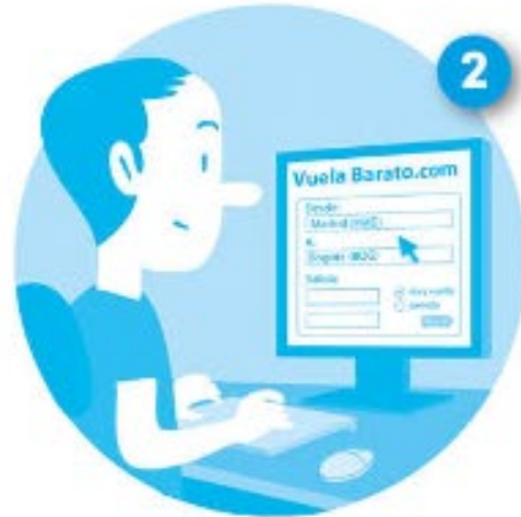
buscador de vuelos