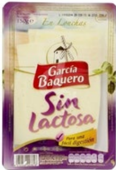
Un paquete de queso en lonchas