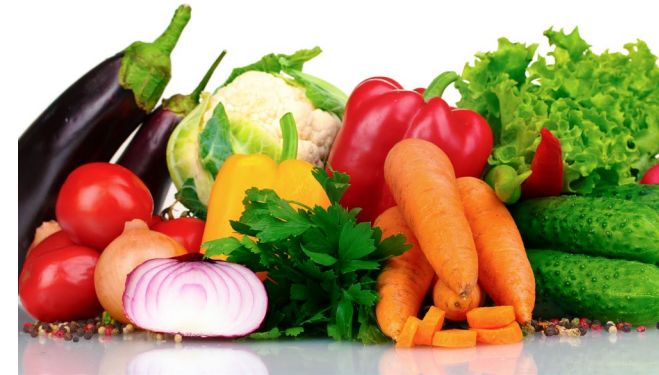
Verdura. ¿Qué verduras son?

Plátano – naranja – mango – pera – uva – manzana – kiwi – fresa – cereza