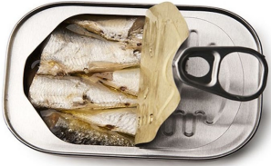
Una lata de sardinas