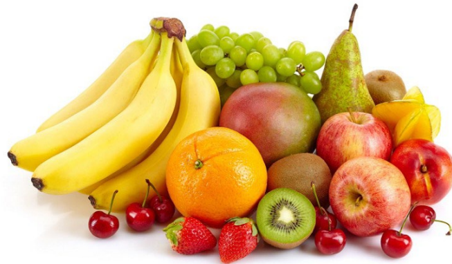
Fruta. ¿Qué frutas son?

Plátano – naranja – mango – pera – uva – manzana – kiwi – fresa – cereza