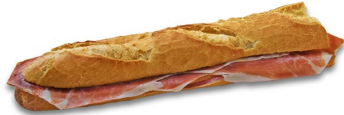
Un bocadillo de jamón