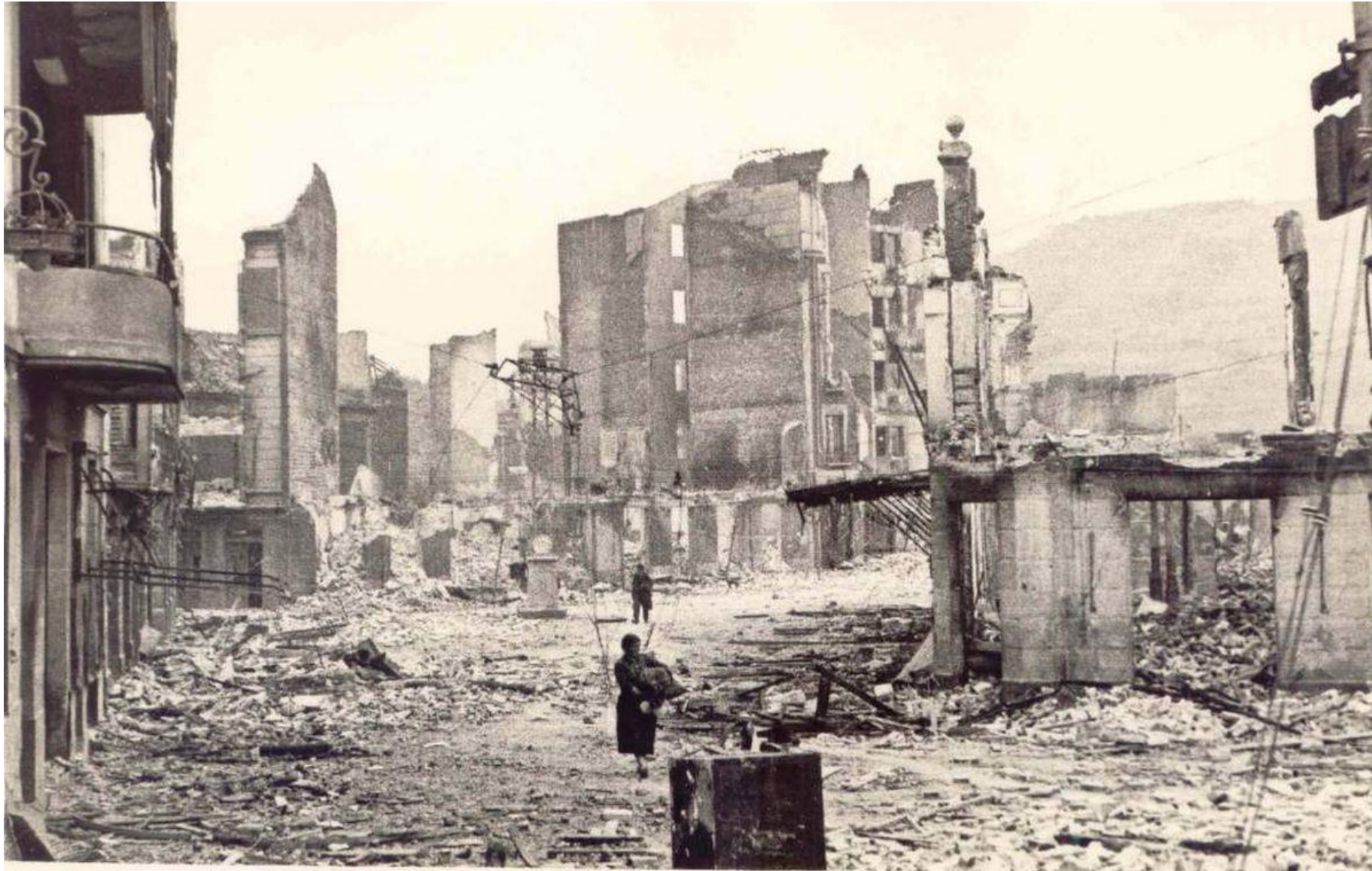
Los edificios en el antiguo pueblo vasco de Guernica fueron arrasados después de un ataque aéreo perpetrado por la Luftwaffe alemana, el 26 de abril de 1937.