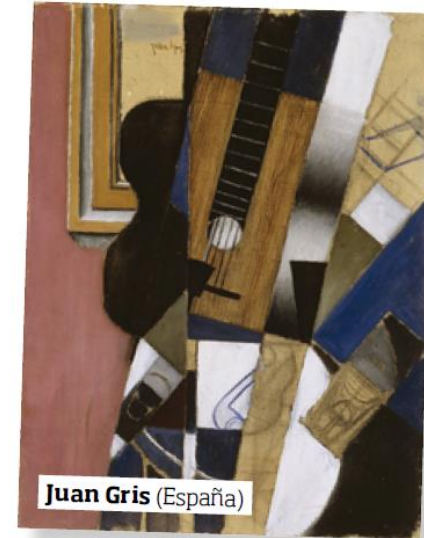
Juan Gris (España)