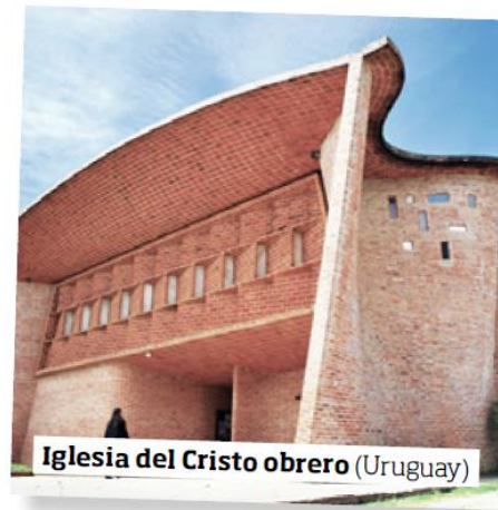
Iglesia del Cristo obrero (Uruguay)