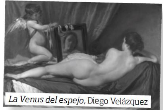
La Venus del espejo , Diego Velázquez