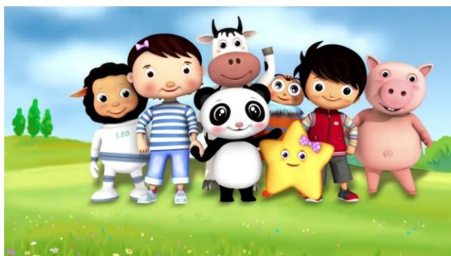
Los dibujos animados