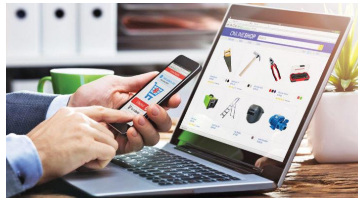
Venta en línea