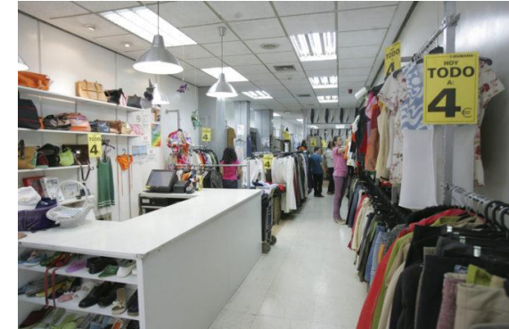
Tienda de segunda mano