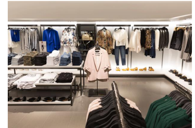
Tienda de ropa