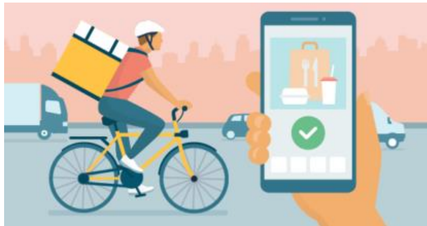
Servicio a domicilio