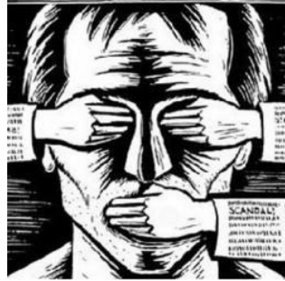
Defensor del lector