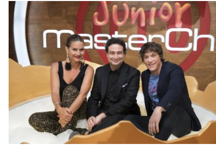
Defensor del telespectador