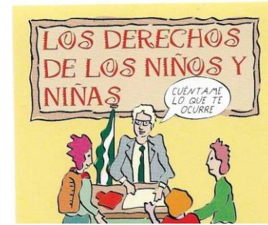
Defensor del menor