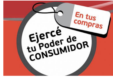
Defensor del consumidor