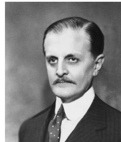
1936 Carlos Saavedra Lamas