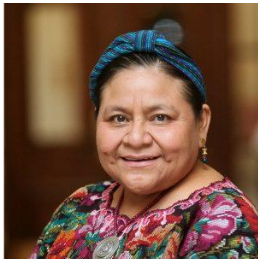
1992 Rigoberta Menchú Tum