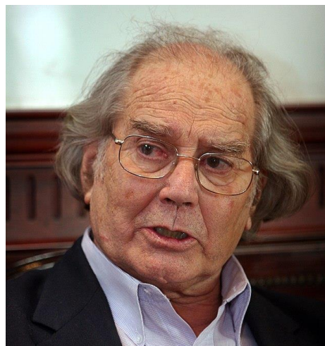
1980 Adolfo Pérez Esquivel