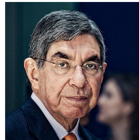
1987 Óscar Arias Sánchez