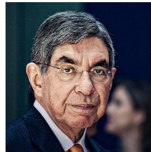
1987 Óscar Arias Sánchez