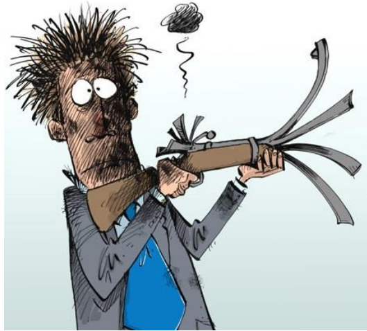
Salirle el tiro por la culata