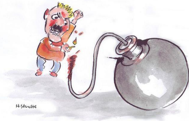
Apuntarse a un bombardeo