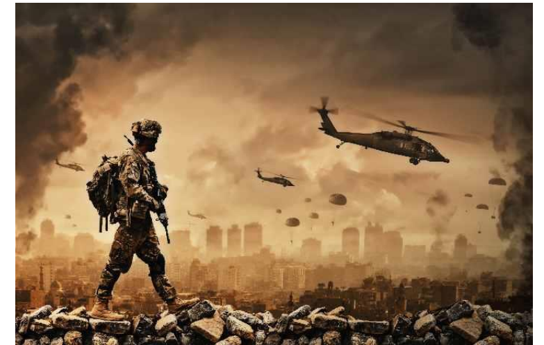
Quedarle mucha guerra por dar