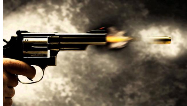
Tirar con bala