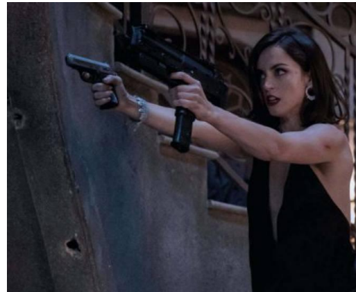
Ser de armas tomar