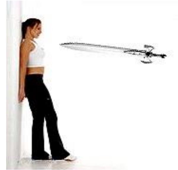
Estar entre la espada y la pared