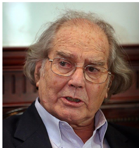
1980 Adolfo Pérez Esquivel