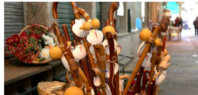
El bastón – la calabaza