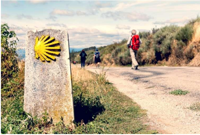
La concha de la vieira