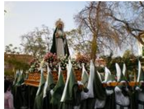
4: La Semana Santa