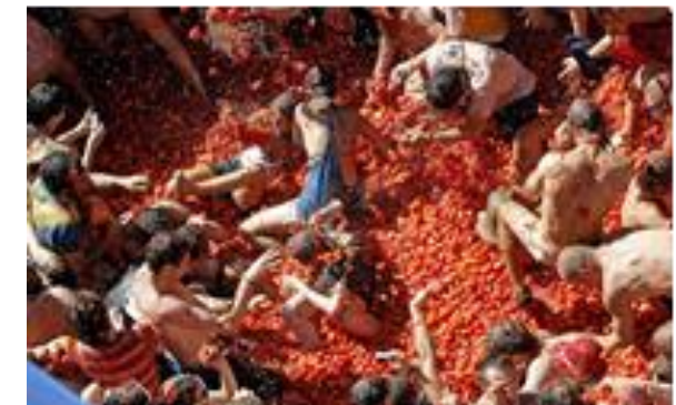
2: La tomatina de Buñol