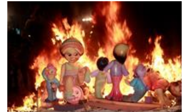
3: Las Fallas