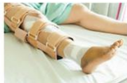
Una pierna rota