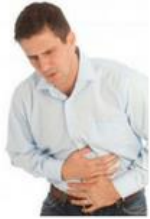
Dolor de estómago