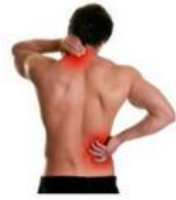
Dolor de espalda