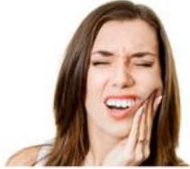
Dolor de muelas