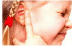
Dolor de oído