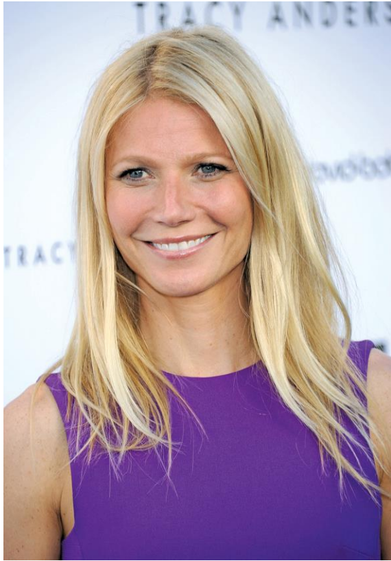
Gwyneth Paltrow, actriz estadounidense