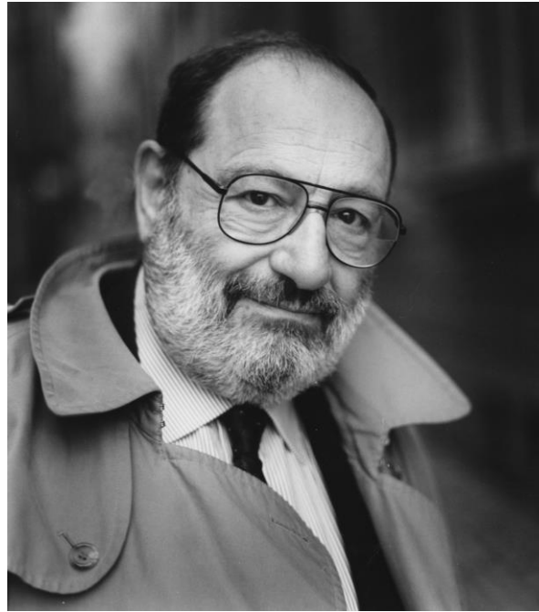
Umberto Eco, escritor y filósofo italiano