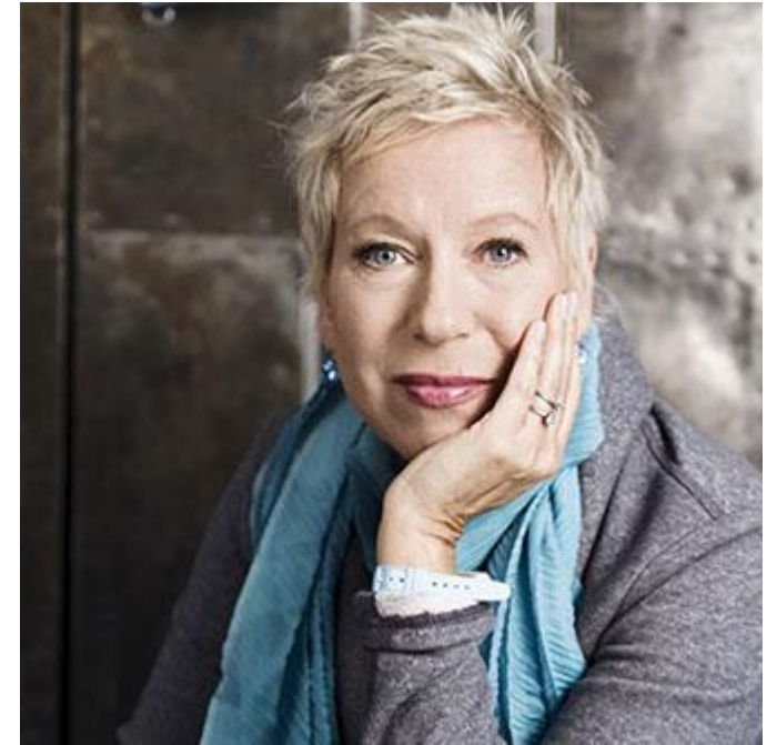
Doris Dörrie, directora de cine alemana