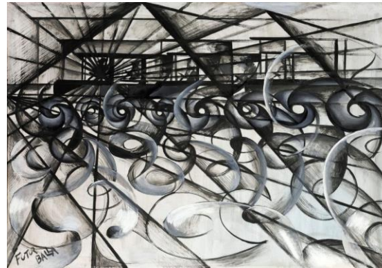
Velocidad del automóvil (1913) por Giacomo Balla = futurismo