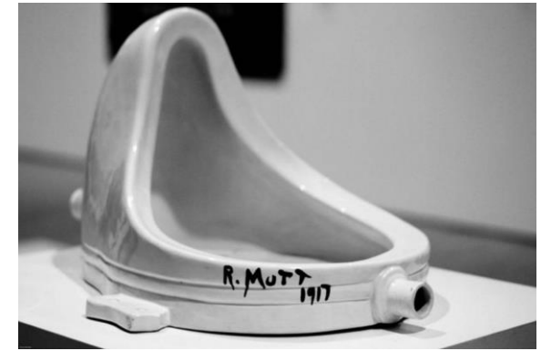
La fuente (1917), de Marcel Duchamp = dadaísmo