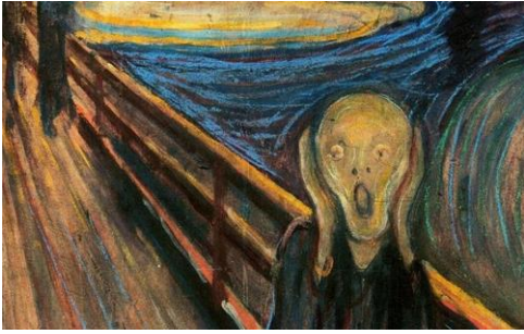
El grito (1893) por Edvard Munch = expresionismo