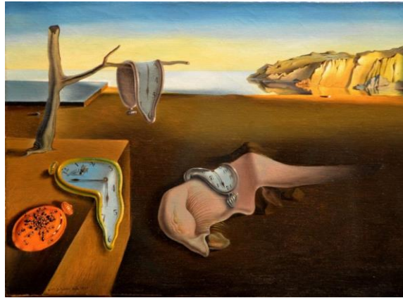
La persistencia de la memoria (1931) por Salvador Dalí = surrealismo